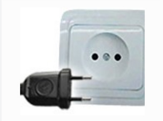
Tipo C: también funciona con tomas de corriente tipo E y F