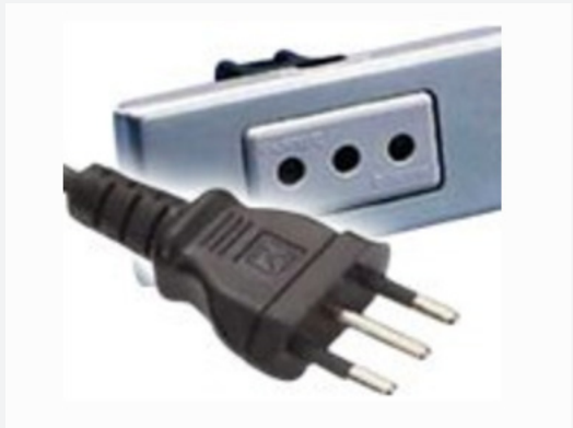
Tipo L: también funciona con tomas de corriente tipo C